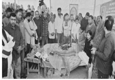
दुःख व्यक्त गरको छ ।

चौपालको निधन प्रति भारतका प्रधान मन्त्री नरेन्द्र मोदी शोक व्यक्त गर्दै भने भाजपाको वरिष्ठ नेता र राम जन्मभूमि तीर्थ क्षेत्र ट्रस्टको सदस्य कामेश्वर चौपालको निधनले