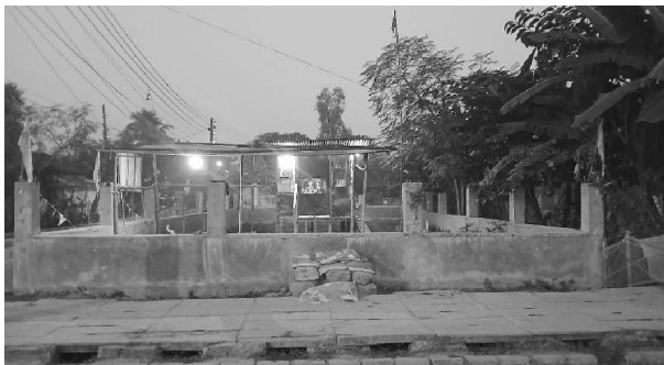
यादव चौक पार्क तथा खुल्ला व्यायमशाला निर्माण स्थल

तर सोही स्थानमा २०८१ सालको कृष्णजन्माष्टमीको अवसरमा कृष्णको मुर्ति राखेर