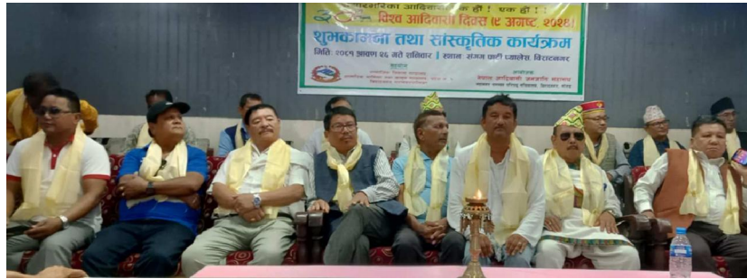
३० औं विश्व आदिवासी जनजाति दिवसको अवसरमा गरिएको कार्यक्रमका प्रमुख अतिथी अतिथीहरू ।

विराटनगर । अठारवटा जातिय संस्थाहरू द्वारा विराटनगरमा विभिन्न कार्यक्रम आयोजना गरी ३० औं विश्व आदिवासी जनजाति दिवस भव्यताका साथ सम्पन्न गरेको छ । विराटनगर महानगरपालिका भित्रका १८ वटा जातिय सामुदायले आफ्नो जातिय पोशाकमा सजिएर