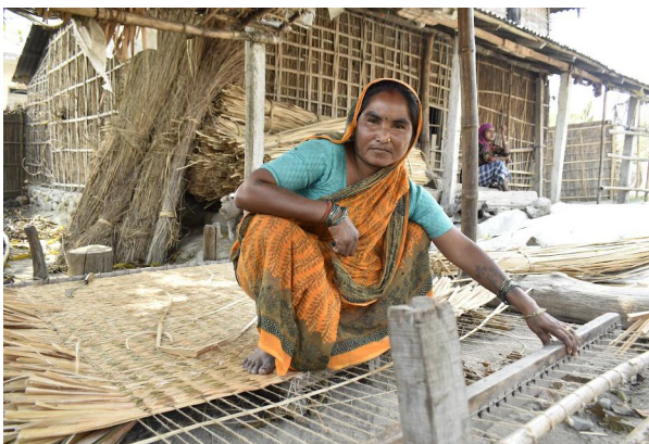
बाँतर समुदायको महिलाहरूले पटेरको गुन्द्री बुन्दै ।

विराटनगर । कोशी प्रदेशको सुनसरी जिल्लाको कोशी गाउँपालिका-२ कुशहा टोलका बाँतर समुदायका महिलाहरूले पटेरको गुन्द्री बेचेर जसोतसो जीविकोपार्जन गरि रहेका छन् । वर्षौँ देखि पटेरको गुन्द्री बनाएर विक्री वितरण गर्दै आएका बाँतर समुदायका महिलाहरू अहिले सम्म पूर्ण रूपमा आत्मनिर्भर हुन सकेका छैनन् । उनीहरूले बनाएको गुन्द्रीले समेत उचित बजार पाउन सकेको छैन ।