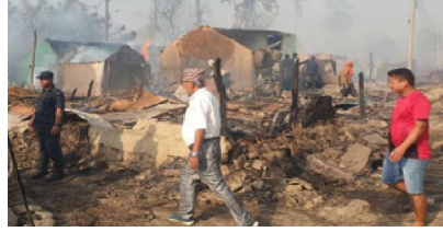
मोरङको रङ्गेली-३ सन्थाल वस्ती आगलागीले खराबी