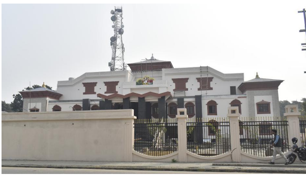
धरोहरको रूपमा रहेको विराटनगरको वीरेन्द्र सभागृह पुनर्निर्माण पछिको नयाँ स्वरूप