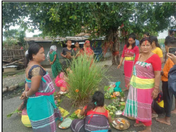
नेपालको पूर्वी भागमा पर्ने सुनसरी, मोरंग र भोजपुर जिल्लामा खासगरी बसोबास गर्ने राजवंशी समुदायको ऐतिहासिक पौराणिक रोधापोथा पुजा अनुष्ठान गर्दै जहदा गाउँपालिका वडा नं. २ का महिलाहरू सामूहिक रूपमा मनाउँदै। रोधापोथा पूजाले शरीरको क्षमता विकास र शरीरलाई निरोगिता बनाउने तथा सुख-दुःखमा एक अर्कासाथ सहयोग गर्ने पौराणिक मान्यता रहेको छ। सो पूजामा सुखी र दुःखीका कथा वाचन गरिन्छ। यो पुजा अषाढको कुनै पनि विहीवार मात्र मनाउने गरेको भगवतीया राजवंशीको भनाई छ।

□ वर्ष ११ □ अंक ४६ २०८० अषाढ १७ गते आईतवार Sunday 2, JUL 2023 □ पृष्ठ: ६, □ मूल्य रु. १०/-