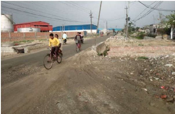
हुलाकी राजमार्गमा पर्ने कटहरी गाउँपालिकाको सडक खण्डको दुर्रशा । यस्तै दुर्रशा मोरंगको जहदा गाउँपालिका, सुनसरी नगरपालिका र रतुवामाई नगरपालिका भोगि रहेको छ ।