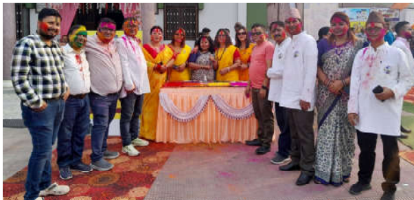
विराट व्यापार संघले होली मिलन कार्यक्रमपछि सामूहिक फोटो खिचाउँदै ।