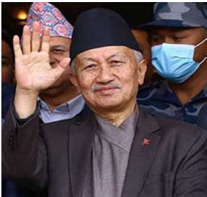
राष्ट्रपतिका उम्मेदवार नेकपा एमालेका उपाध्यक्ष सुवासचन्द्र नेम्वाङ

नेकपा माओवादी केन्द्रका अध्यक्ष एवं प्रधानमन्त्री पुष्पकमल दहालले प्रतिनिधी र प्रदेश सभाको निर्वाचनमा नेपाली कांग्रेस लगायतका दलसंग गठबन्धन गरी चुनाव लड्नेका थिए भने निर्वाचनपछि नेकपा एमाले लगायत दलको समर्थनमा दहाल प्रधानमन्त्री बनेका थिए । राष्ट्रपति निर्वाचनका लागि राष्ट्र सहमती भन्दा नेकपा एमालेलाई छोडेर दहालले आठ दलीय गठबन्धन गरी राष्ट्रपति निर्वाचनको लागि कांग्रेसबाट उम्मेदवारी दर्ता गराएका पौडेललाई समर्थन गर्ने भएको छ ।