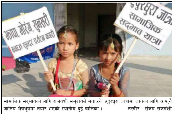
सामाजिक सद्भावको लागि राजवंशी समुदायले मनाउने हुदुरधुरा जात्रामा जानका लागि आफ्नै जातिय भेषभूषमा तयार भएकी स्थानीय दुई बालिका ।

व्यापार संघ मोरंगको हलमा पत्रकार सम्मेलन गर्दै उनीहरूले विभिन्न ६ बुँदे माग गरेका छन् ।