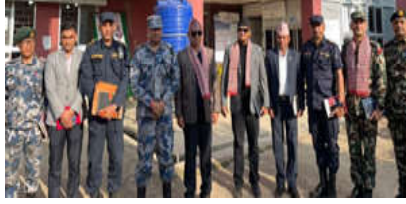
इलाम जिल्लाको मतदान स्थल अनुगमन टोली

भापा। मंसिर ४ गते हुने प्रतिनिधि सभा तथा प्रदेश सभा निर्वाचनलाई भएरहित र निष्पक्ष सम्पन्न गराउने उदेश्यले भापा जिल्लाका मतदान स्थलहरूको निरीक्षण तथा अनुगमन भएको छ।