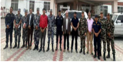
भापा जिल्लाका मतदान स्थल अनुगमन टोली

त्यसैगरी इलाम र पाँचथर जिल्लाका मतदान स्थलहरूको समेत अनुगमन गरिएको छ।