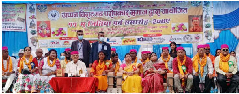
मधेशी, थारु लगायतका विवाहीत महिलाहरूले मनाउने जितिया पर्वको उपलक्ष्यमा गरिएको जितिया समारोहका अतिथीहरू

विराटनगर । तराई मधेशमा बसोबास गर्ने प्राय सबै जातिको विवाहीत महिलाहरूले मनाउने जितिया पर्व ऐतिहासिकता एवं पौराणिकतासंग जोडिएर एकताको संदेश दिएका छन् ।