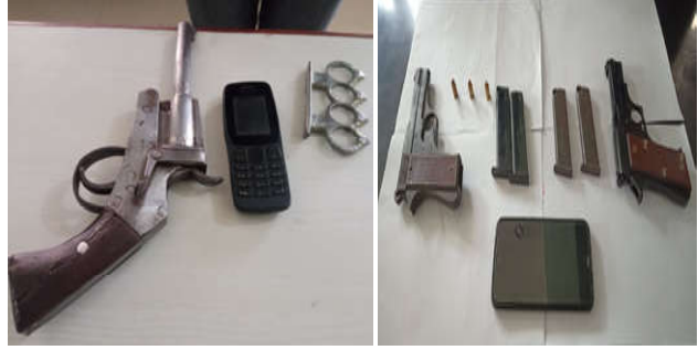
सुनसरीको दुहवी नगरपालिकाबाट बरामद भएका कोशी गाउँपालिकाबाट बरामद भएको पेस्तोलहरू।

त्यसैगरी सोमबार जिल्ला प्रहरी कार्यालय सुनसरी र इलाका प्रहरी कार्यालय लौकही सुनसरीबाट खटिएको प्रहरी टोलीले गोथ सुचनाको आधारमा सुनसरीको कोशी गाउँपालिका वडा नं. १ स्थित वि.एस. होटलबाट भारत