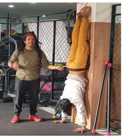
त्यसैगरी कुनै पनि उपकरण विना व्यवस्थित लय बद्ध शारीरिक अभ्यासको माध्यमबाट गरीने

त्यसैले मलामी जानेहरू अनिवार्य रूपमा नुहाएरै फर्किन्छन् र आफूले लगाएका सम्पूर्ण कपडा अवश्य धुन्छन् । मलामी जानेहरूमध्ये जो कोही पनि अरुको जीउमा छोइँदा उसले लगाएका सम्पूर्ण कपडा