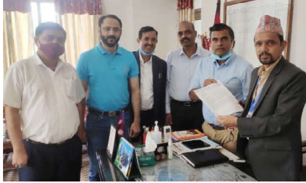
हाटखोलाको सिंधिया पुललाई जिर्णोद्धार गर्न माग गर्दै प्रमुख जिल्ला अधिकारीलाई जापानपत्र बुझाउँदै ।

विराटनगर महानगरपालिका र कटहरी गाउँपालिका जोड्ने रंगेली रोड सडक खण्डमा पर्ने विराटनगरको हाटखोला स्थित सिंधिया पुलको नाजुक अवस्था प्रति संघको गम्भीर ध्यानाकर्षण भएको जनाउँदै मोरङ-सुनसरी आर्थिक कोरिडोर अन्तर्गत रहेको कटहरी