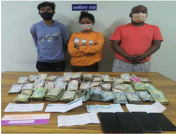
ब्रामद गरेको थियो।

साह र चौधरीको साथबाट प्रहरीले नेपाली रुपैयाँ २१ लाख ७१ हजार ५ सय र भारतीय रुपैयाँ २३ हजार तथा विभिन्न बैकका चेकहरू