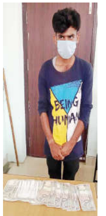
ईलाका प्रहरी कार्यालय रानीमा लिई थप अनुसन्धान भई रहेको प्रहरीले जनाएको छ,

कार्यालय ईटहरी सुनसरी तथा जिल्ला प्रहरी कार्यालय मोरङबाट खटिएको संयुक्त टोलीले चेकजाँच गर्ने क्रममा साहले लुकाई छिपाई राखेको अवस्थामा १ थान कटुवा पेस्टोल र सोही पेस्टोलमा लाग्ने २ राउण्ड गोली बरामद गरेको थियो । हतियार सहित पक्राउ परेका साहको सम्बन्धमा प्रहरीले थप अनुसन्धान गरिरहेको छ ।