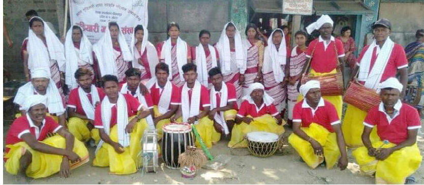
आदिवासी जनजातिमा पर्ने मुडियारी, उराव, सन्ध्याल, कर्मकार, जातिहरु जातिय भेषभूषा र पहिचान भल्काउने पोषकमा सामूहिक फोटोमा ।

रोली । आदिवासी जनजातिमा पर्ने मुडियारी, उराव, सन्ध्याल, कर्मकार, जातिहरुलाई जातिय भेषभूषा र पहिचान भल्काउने पोषक र गायनमा प्रयोग हुने बाजागाजाहरु वितरण गरिएको छ ।