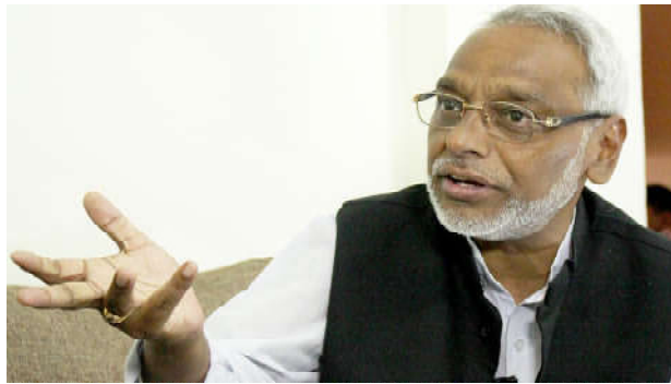
राजेन्द्र महतोसँग विशेष अन्तर्वार्ता, वरिष्ठ नेता, जनता समाजवादी पार्टी नेपाल

- हाम्रो धी दुईटै कुरा जोडिन सक्छ । हाम्रा राजनीतिक मागहरू जुन विगतमा पूरा हुन सकेन । यो केपी ओलीको सरकारलाई हामीले विगतमा बाहिरबाट समर्थन गरेका थियौं र उपेन्द्र यादवजी दुईबुदे सहमति गरेर सरकारमै सहभागी हुनुभएको थियो । खासगरी, त्यो संविधान संशोधनका सवालहरू थिए, त्यतिबेला त्यो सवाल सम्बोधन गरिएन । त्यसपछि हामीले समर्थ फिर्ता लिएका थियौं, उपेन्द्रजी सरकारबाट बाहिर आउनुभएको थियो । त्यो सवाल मुख्य हो । यो शुभ संकेत त हो, विश्वासको वातावरण बनाउने सरकारको यो निर्णयबाट भएको हो । अब मुख्य सवाल संविधान संशोधनको विषयवस्तुमा प्रवेश गर्नुपर्ने हो । प्रधानमन्त्रीजीले भन्दै आउनुभएको आवश्यकता र औचित्य स्वीकार गरेर संशोधनको प्रक्रियामा लैजानका लागि