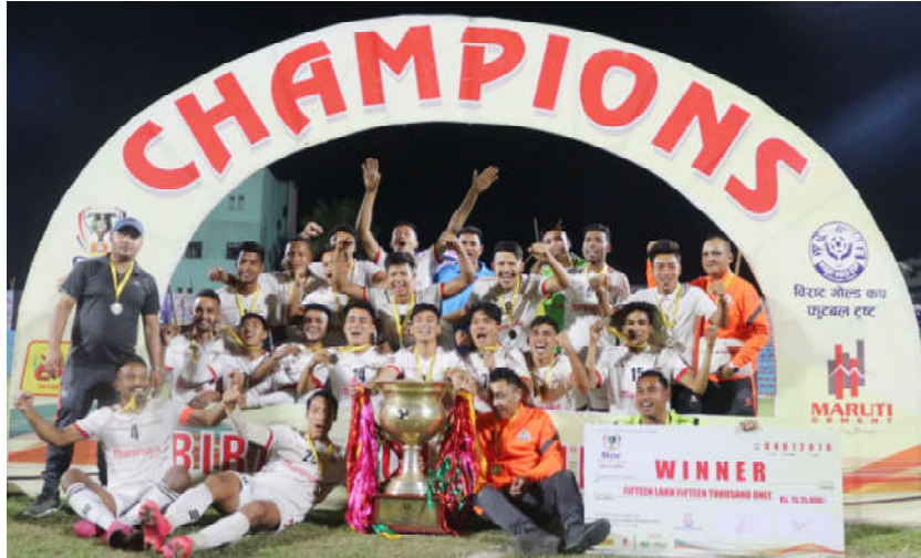
२०७७ साल चैत २६ गते देखि शुरु भएको विराट गोल्डकपको फाइनल खेल २०७८ साल वैशाख ४ पंजाव पुलिस क्लब र एपिएफ बीच भएको रोमान्चक खेलमा १ गोलले पंजाव पुलिसलाई पराजित गरी विजय भएपछि सामूहिक फोटो खिचाउँदै एपिएफ टिम ।