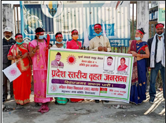
नेकपा ओली समूहको प्रदेश नं. १ को विराटनगरमा शनिवार भएको विशाल सभामा अखिल नेपाल पिछडावर्ग (ओविसी) को सहभागिता ।