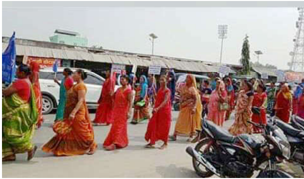
विराट राजवंशी जातिलाई सुचीत गराउन दबाव मुलक न्यालीमा सहभागी महिलाहरु ।

राजवंशी समाज उत्थान समिति (विराट) का अगुवाहरूले भूमिपुत्र विराट राजवंशीहरूलाई राज्यले अन्याय गरेको गुनासो गर्दै प्रकृतिका पुजारी, भूमिको रक्षा गर्ने विराट राजवंशीलाई राज्यले आदिवासी जनजातिमा सुचिकृत नगरेर अन्याय गरेको भन्दै आक्रोस पोखेका थिए ।