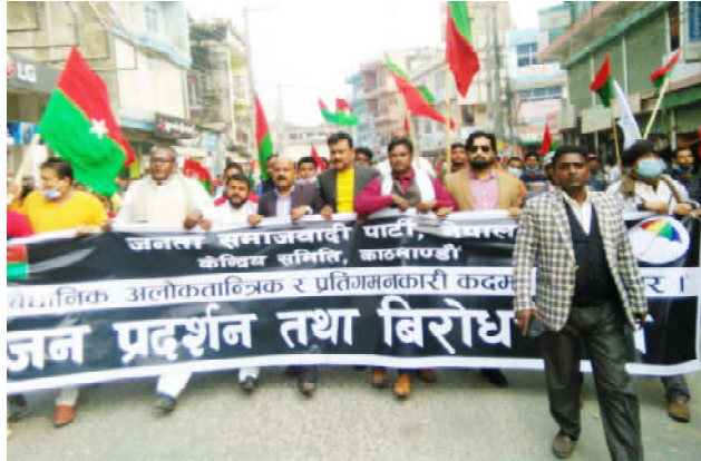
जनता समाजवादी पार्टी नेपालको प्रतिनिधी सभा विघटन खारेज गर्न जन प्रदर्शन तथा बिरोध याली

बहालै भन्ने संविधानलाई सञ्चालन मध्येगी, आदीवासी जनजाति, दलित, महिला, मुस्लिम लगायतको अधिकारलाई सुनिश्चित गर्न हाम्रो पार्टीको समर्थनमा दुई तिहाई बहुमत प्राप्त सरकार बनेको थियो । तर ती सरकारले देशमा आर्थिक विकास, कृषि विकास, औद्योगिक विकास