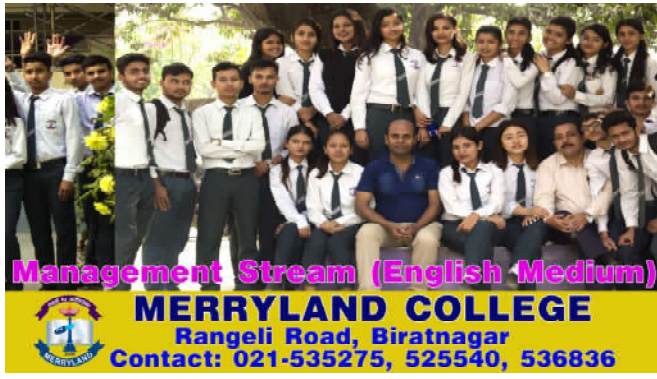
Management Stream (English Medium) MERRYLAND COLLEGE Rangeli Road, Biratnagar Contact: 021-535275, 525540, 536836

अध्ययनमैत्री वातावरण बनाउन सफल संस्थाले प्रविधिमैत्री शिक्षा, नियमित आन्तरिक परीक्षा प्रणाली, आवश्यकता अनुसार १२ महिना अतिरिक्त कक्षा, प्रोजेक्ट वर्क बेसलगायतका गतिविधी सञ्चालन गर्दै आएको छ । भयरहित वातावरणमा गुणस्तरीय शिक्षा प्रदान गर्दै आएकोले सफलता प्राप्त गरेको