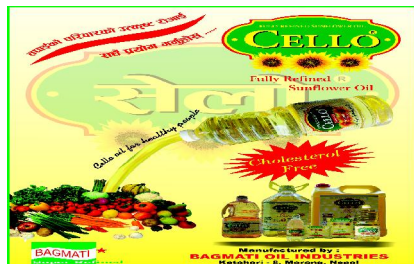
Manufactured by BAGMATI OIL INDUSTRIES, Bhatari, S. Sundari, Nepal

विध्रीवत रूपमा कोषी अस्पताल विराटनगर वाट निर्मलीकरण अभियान शुरु गरी महानगर पालिका नगरक्षेत्रमा कोरोना भाइरसको संक्रमण नियन्त्रणका लागि डिस इन्फेक्सन अर्थात निर्मलीकरण अभियानको शुरुवात गरिसकेको छ।