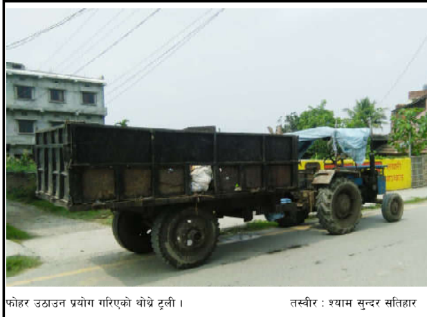
फोहर उठाउन प्रयोग गरिएको थोथे टूली ।

विराटनगर महानगर पालिका वडा नं. १२ मा फोहोर सडकमै चुहाउदै गरेको देखिएको छ । कोभिड-१९ को विश्व महामारीको सन्त्रासको बेला विराटनगर महानगर पालिका वडा नं. १२ मा फोहर संकलन गरी रहेको थोथे टूली प्रयोग गर्दा संकलित फोहर टूलीबाट फोहर सडकमा चुहिएर सडकनै दुर्गन्धी भएको वडाका स्थानीय बासीले गुनासो गरेका छन् ।